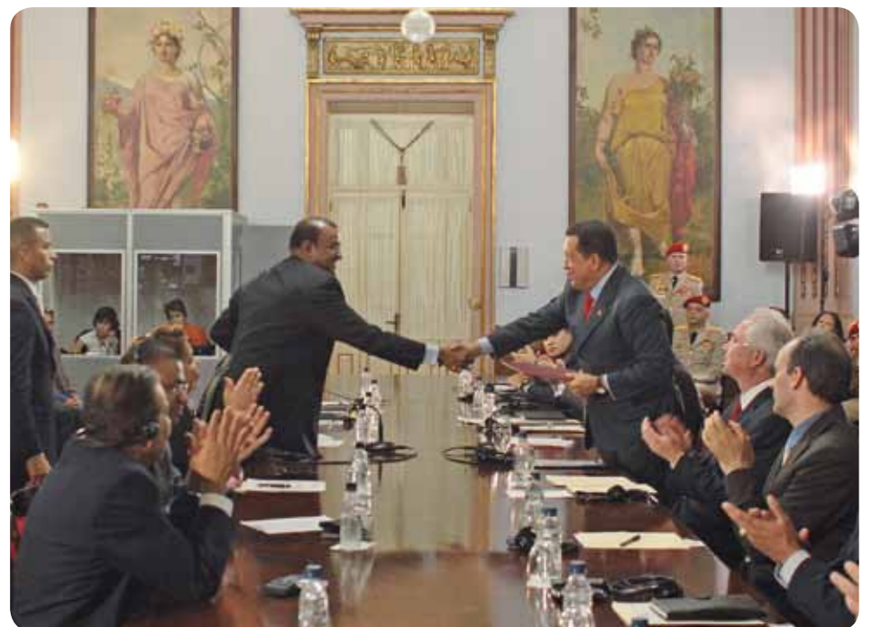
Chávez fortaleció las relaciones con Guyana a través de acuerdos de cooperación, como Petrocaribe

inició nuevamente el camino de las negociaciones para el arreglo práctico de dicha controversia territorial pendiente, para que se resuelva de forma amistosa y pacífica.